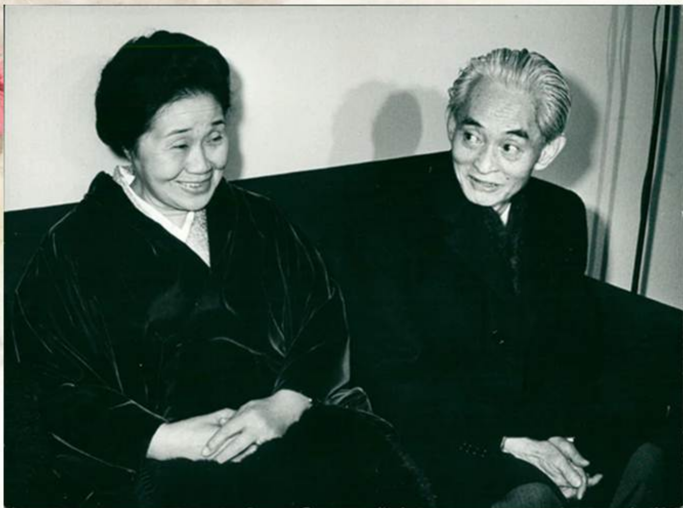
Нобелевский лауреат по литературе Ясунари Кавабата с женой.