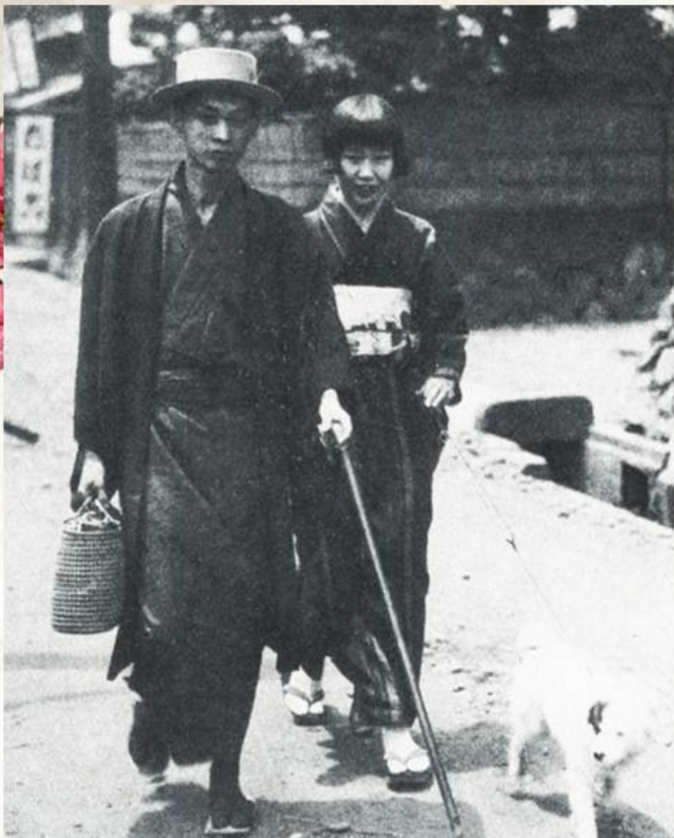
Писатель Ясунари Кавабата и его жена Хидеко, 1929 год.